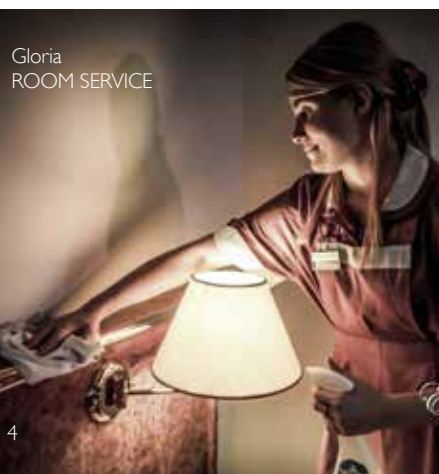
Gloria ROOM SERVICE

Services inclus dans les tarifs du séjour: Possibilité de menu salubre avec régime calorique contrôlé, libre accès aux piscines thermales dotées de circuit relaxation et jeux d'eau, peignoir, chaussons, serviette de bain et bonnet de bain pour la durée du séjour, accès internet WI-FI, cours quotidiens de Stretching Aquagym et Pilates, cours de tennis et réservation de golf green fees, soirées musicales (dimanche, mardi, jeudi), Transfert gratuit pour la ville de Padoue A/R (samedi après-midi). Services disponibles à la demande du client: Late check-out 25€, garage privé 15€ par jour, Repas extra pension 36€, Service à l'étage 10€ par personne, Panier de voyage 10€ par personne, Location de voitures et de bicyclettes, manège, visites guidées des villes d'art (Venise, Padoue, Ferrare), 4 terrains de Golf à 10 minutes de l'hôtel.