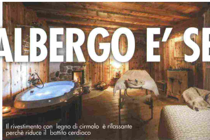
Il rivestimento con legno di cirmolo è rilassante perché riduce il battito cardiaco