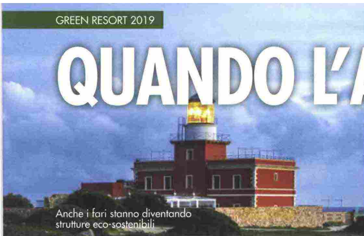
Anche i fari stanno diventando strutture eco-sostenibili