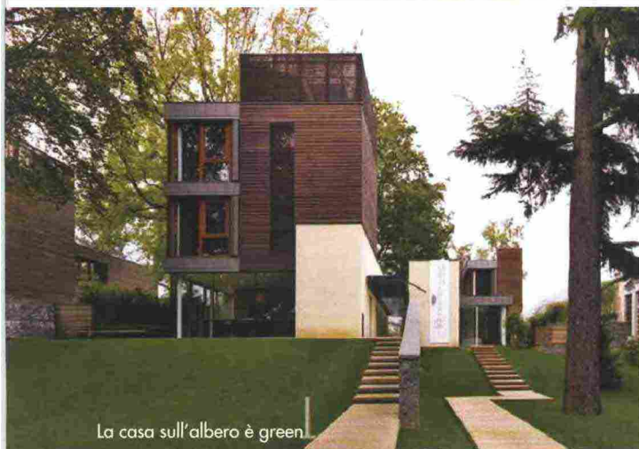
La casa sull'albero è green